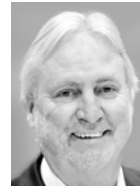
Prof. Dr. Peter Gutzmer Herausgeber ATZ | MTZ-Gruppe, Springer Nature

SUSTAINABILITY AWARD IN AUTOMOTIVE ATZ MTZ ARTHUR LITTLE